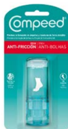
STICK ANTI-BOLHAS Produto Cosmético