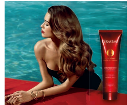
Novo CC Crème para o cabelo O must da estação.

É um creme diário de correcção completo sem passar por água para 3 benefícios para o cabelo exposto ao sol: protecção, reparação e iluminação.